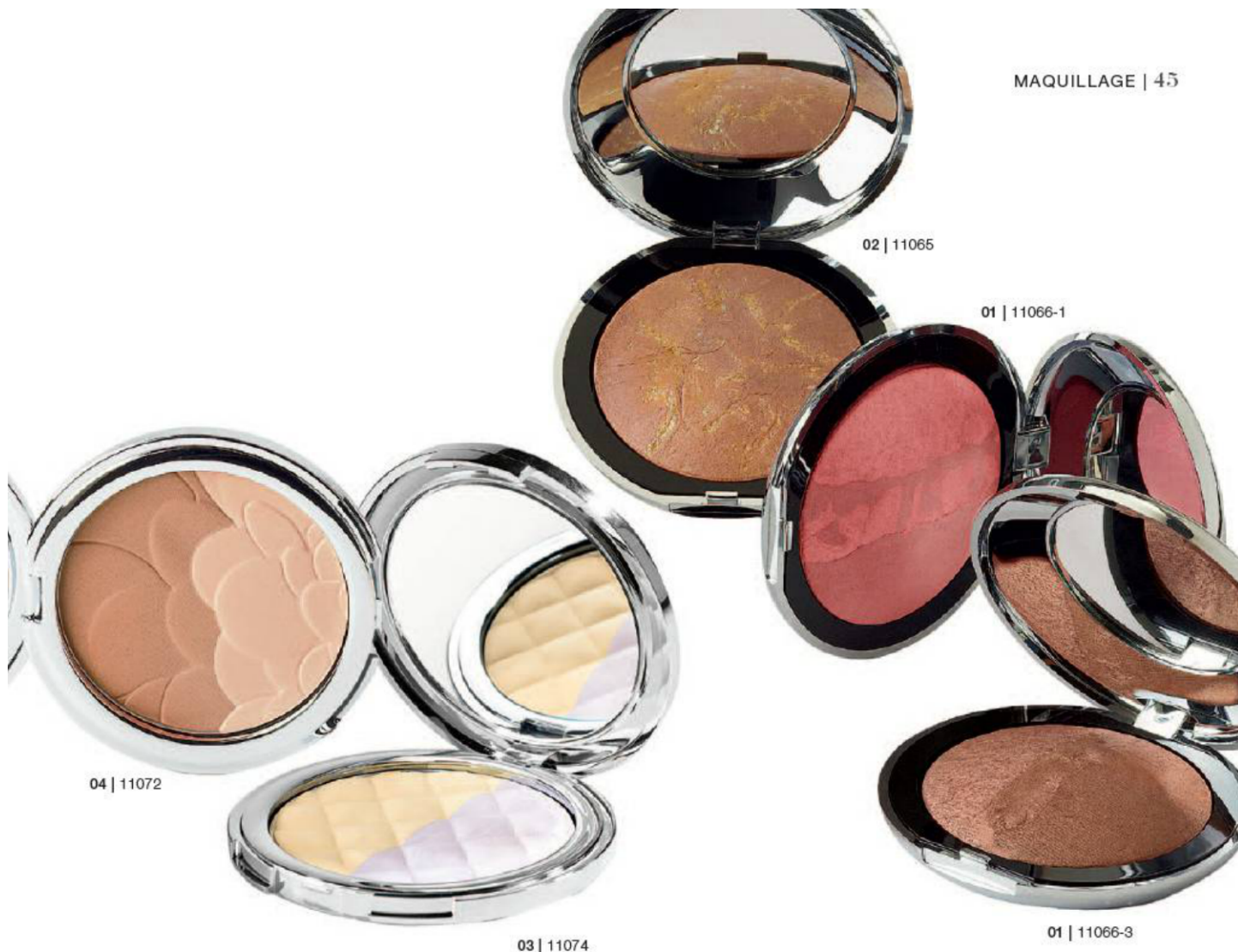
04 | 11072